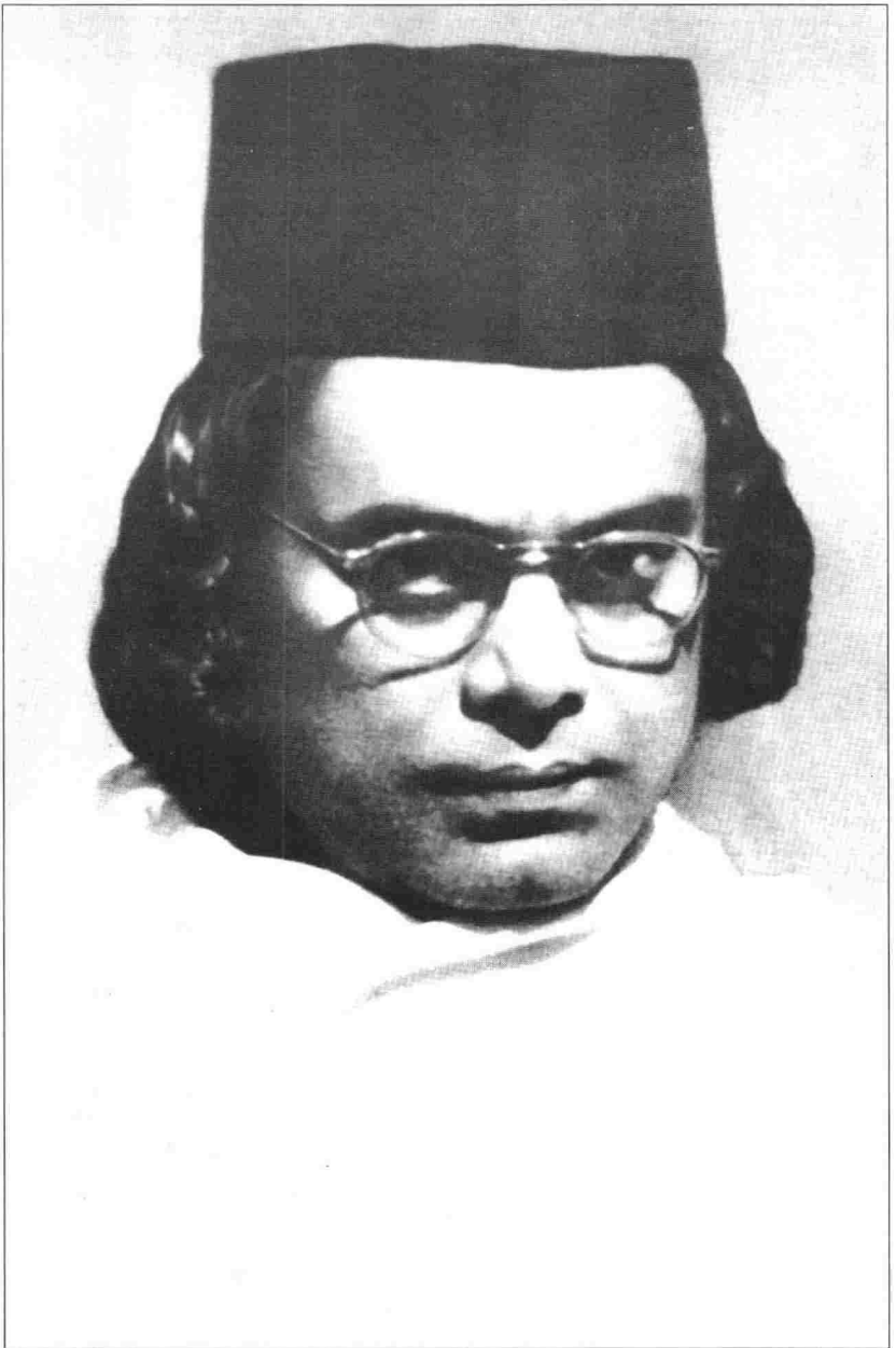
কাজী নজরুল ইসলাম